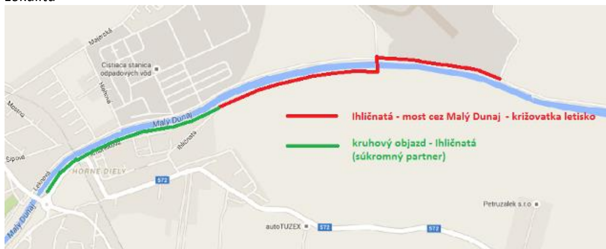
Foto: Umiestnenie budúcej cyklotrasy