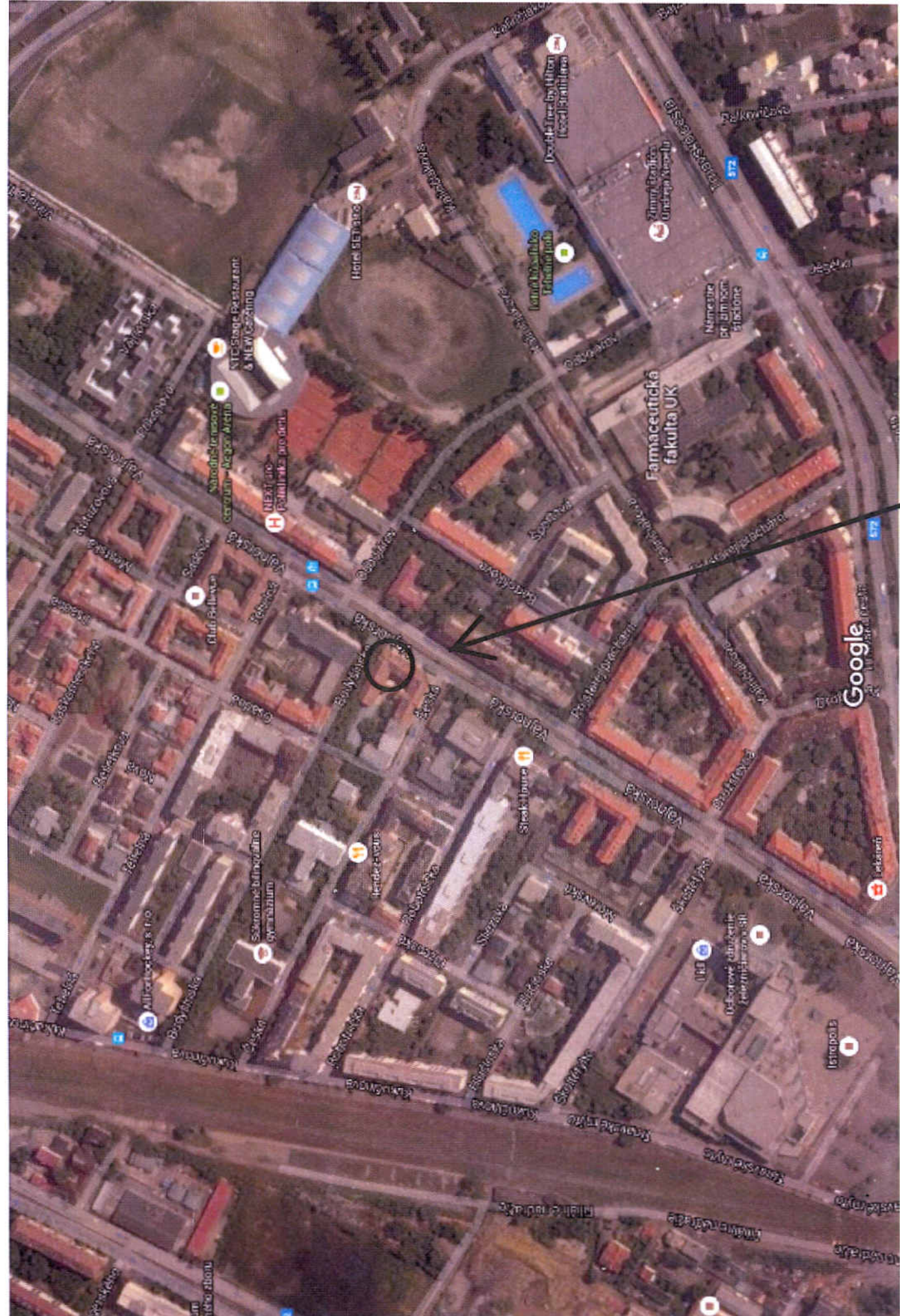
pozemok p.č.11306 k.ú.N.Mesto