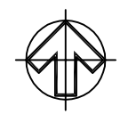
Lokalita cintorín Vrakuňa - MČ Vrakuňa