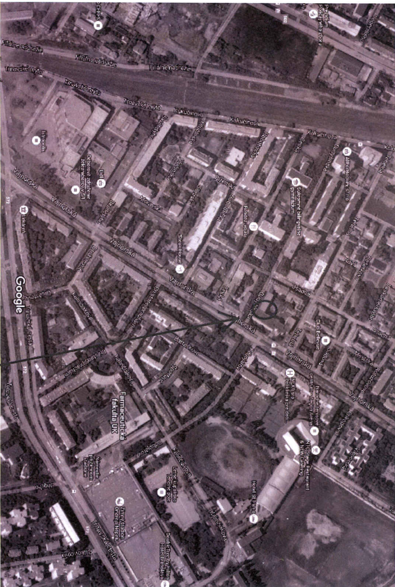
pozemok p.č.11307 k.ú.N.Mesto