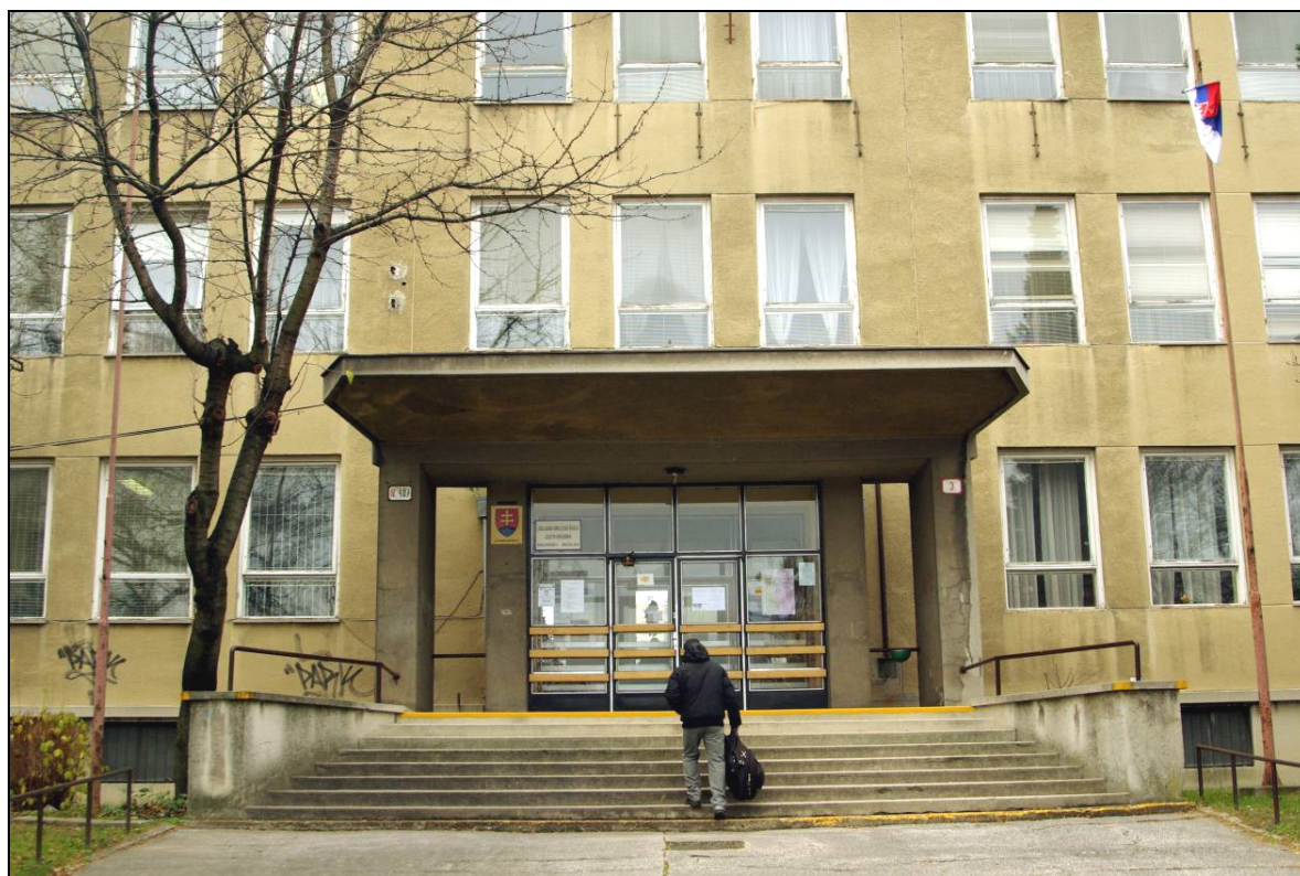
Vstup do školy