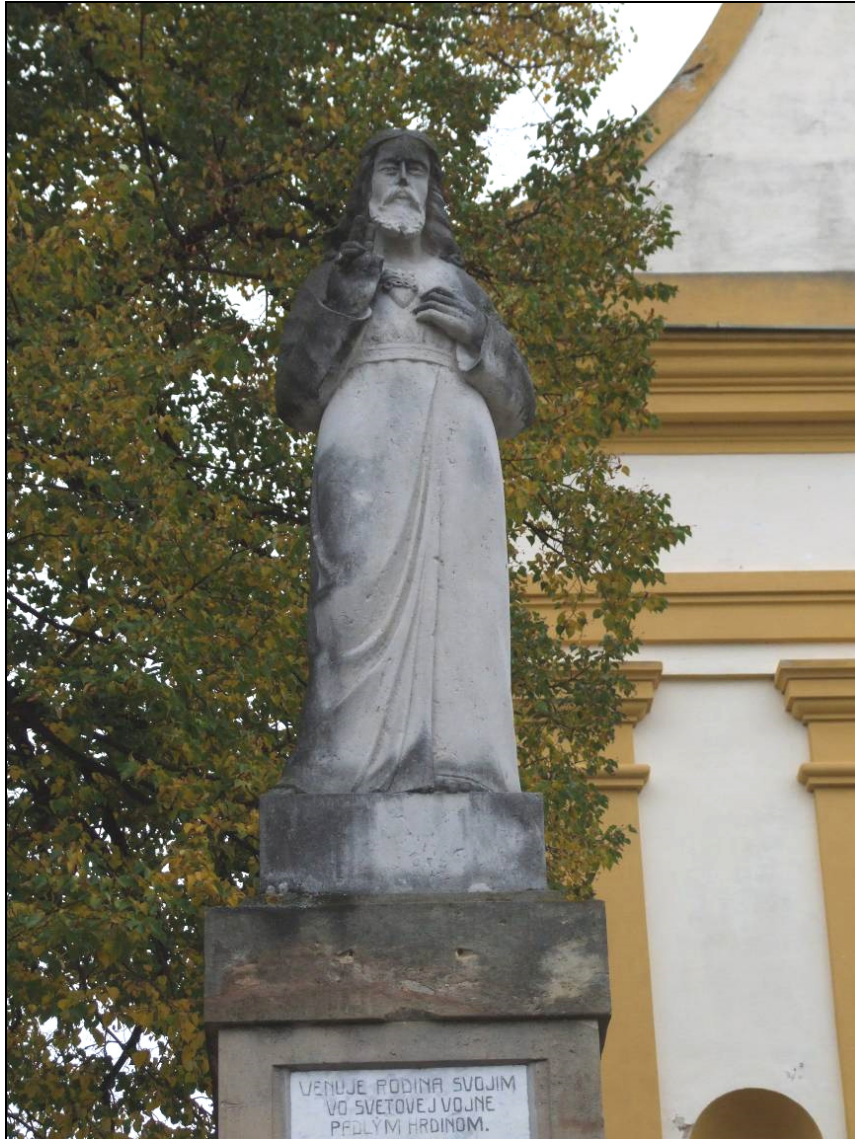
Pomník padlým, socha žehnajícího Krista