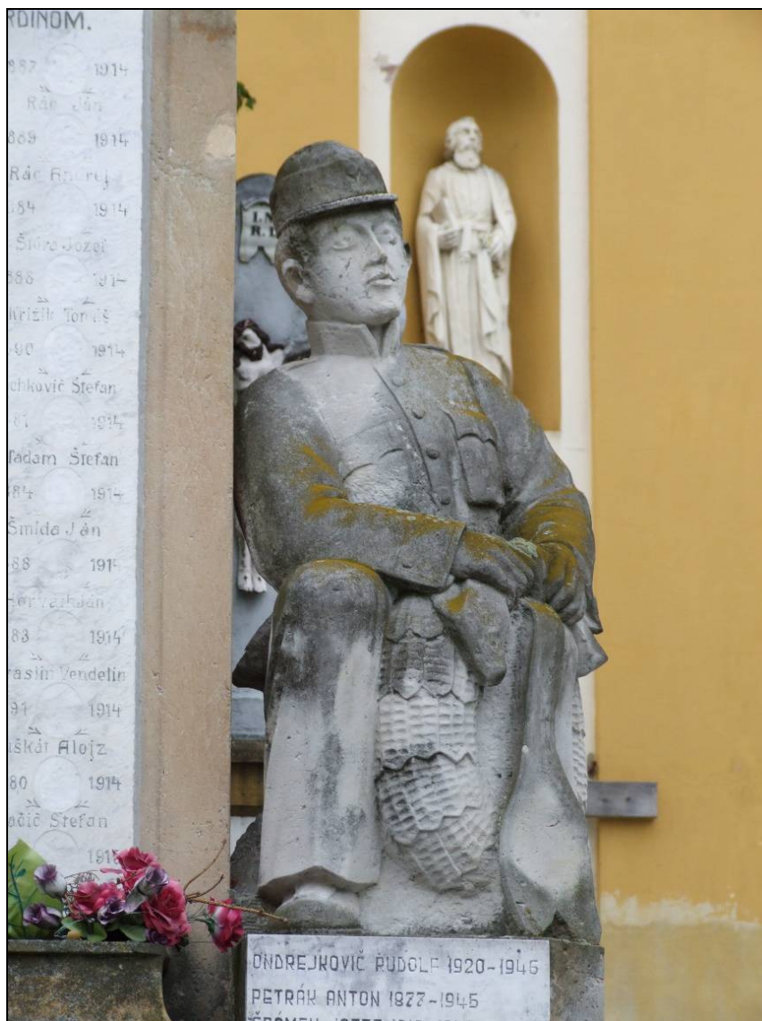
Pomník padlým, socha vojaka