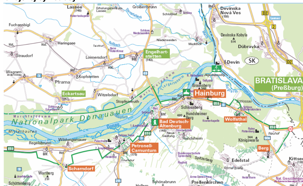
Mapa Dunajskej cyklotrasy: